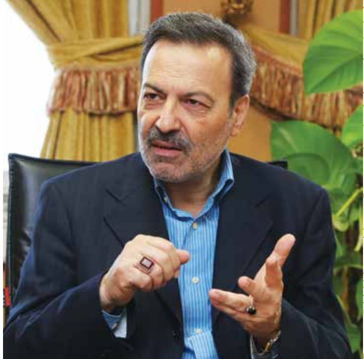
مهندس علی زرافشان، معاون سابق آموزش متوسطه وزارت آموزش و پرورش